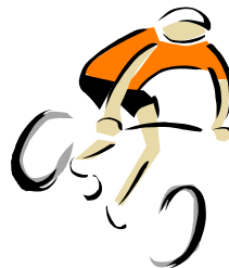
자전거 타기 (cycling)