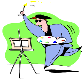
그림 그리기 (painting)