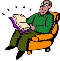
책읽기 (book reading)