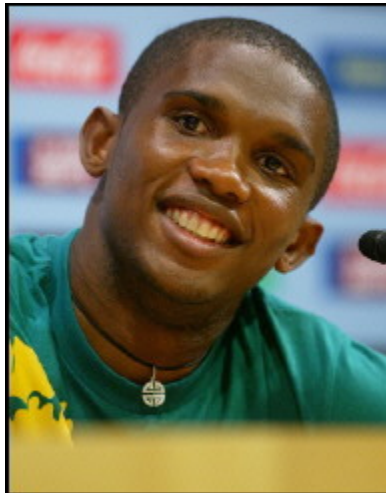
L'attaquant international camerounais du FC Barcelone, Samuel Eto'o, le 29 juin 2005

Read about the favorites for soccer player of the year 2005 and share at least 2 major points from the article.