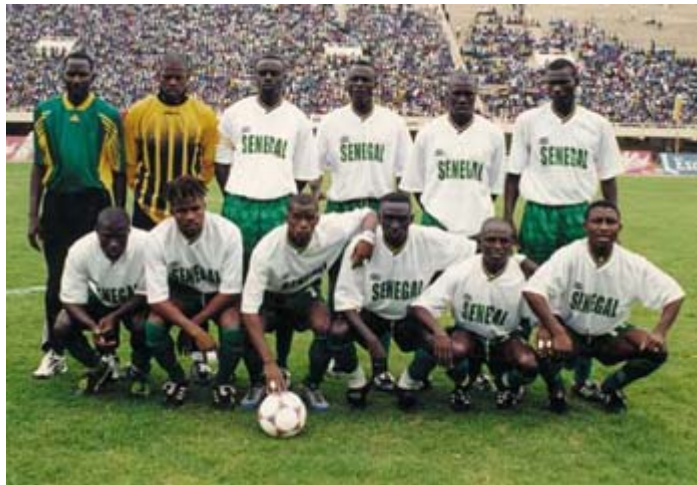
Senegalese Soccer Team

Even though football and baseball are America's most popular sports, they are almost unheard of in Senegal. The fact that these two sports are not also well known in France has a lot to do with why they have not been adopted by Senegal. Indeed, most of the games that have originated from the West came to the country via French influence. However, if you are among those who cannot live without baseball or football, do not despair. Some American TV channels have special broadcasts for the military stationed in Africa and they give a thorough coverage of the world of these sports to the American expatriates. In addition, CNN International, which is also available everywhere in Africa nowadays, provides hourly updates and highlights of American sports.