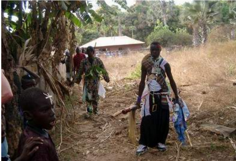
Jeunes Diolas en habit traditionnel

It is Tabaski day. John is spending the day with Amadou and his family. The Senegalese couple, along with their children, is wearing traditional clothes. John sees other members of the Diola group wearing their own traditional costume.