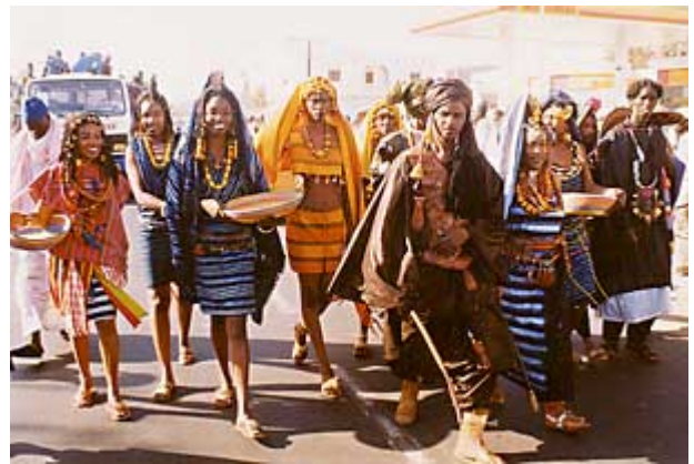
Culture and Traditions