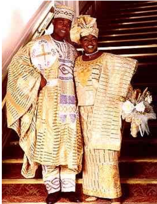
A newly-wed Nigerian couple

Although officially illegal, polygamy is widely practiced in Hausaland (Niger, Côte d'Ivoire) and monogamy is rare among the wealthy. The number of one's wives and children determine his status, respect of command, and to some extent economic opportunities. People with large families are given special consideration because they have greater liabilities. Those in favor of polygamy believe it allows all of the females in a community to be married, whereas monogamy will leave many females without husbands. The anti-polygamists argue that it causes bickering and conflicts among the wives. The pro-polygamists counter with the argument that such conflicts usually arise when the husband is not fair in his dealings with all of the wives. Before a man is allowed to marry more than one wife, he must be certain to have the ability to treat and provide for them equally. A man may marry up to four (4) wives and keep as many concubines as he can afford. However, due to the universal abolishment of slavery, the station of concubine is now an extinct institution because only slaves can serve as concubines.