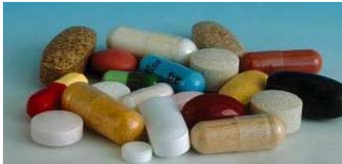
Disease and Medicine